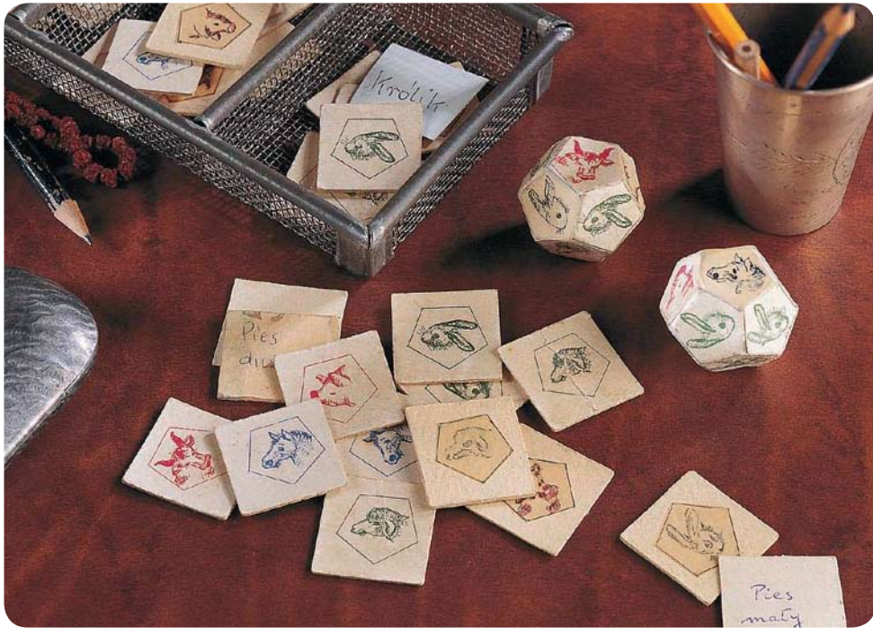
Оригінальна гра «Тваринна ферма» 1943 р.

Оригінальні примірники згоріли в пожежах міста під час Варшавського повстання в серпні 1944 року. На щастя, один примірник зберігся, і через багато років після війни повернувся до родини Борсуків. З нагоди 100-річчя з дня народження пані Зофії Борсук, 25-річчя від дня смерті професора Кароля Борсука та 10-річчя поновлення версії «Тваринної ферми» – «Супер фермер» розважає чергові покоління дітей та батьків. Ми даруємо Вам нову, яскраву, об'ємну, динамічну версію гри. Сподіваємося, що Вам сподобається.